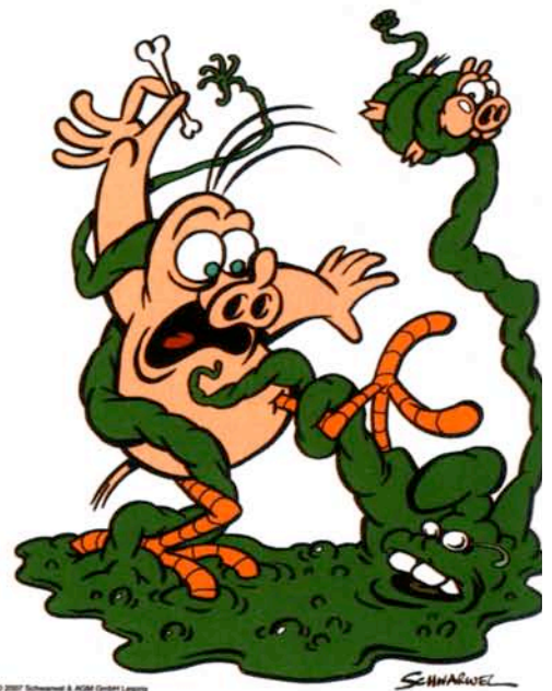
© 2007 Schwarwel & AGM GmbH Leipzig

Und das Beste: Schweinevogel ist wieder der Alte. Zum Knuddeln. Zum Grinsen. Zum »Genau!«-Sagen. Und alle alle alle sind sie immer noch dabei, die es schon immer gegeben hat. Unverkennbar Schweinevogel und seine Freunde. AUGSBURG