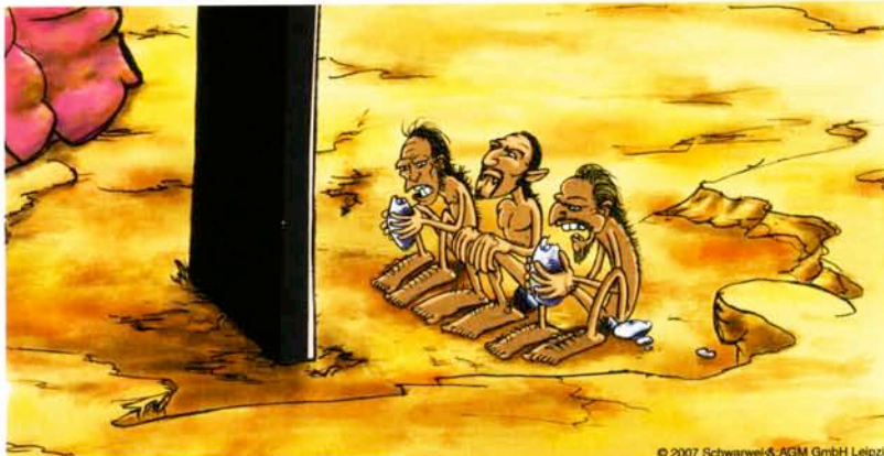
Auf dem Bonbon-Planeten: Ein Hauch von Evolution